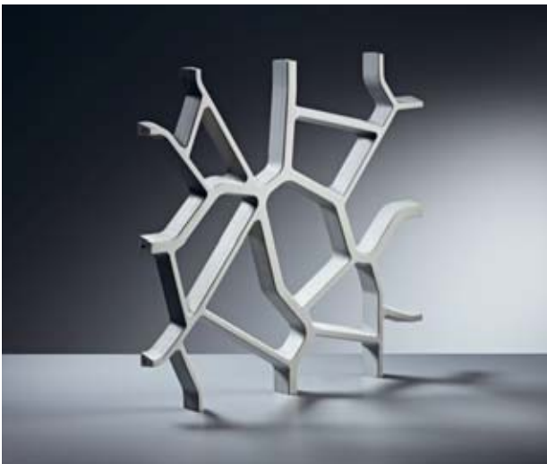
Enveloppe design pour bâtiments neufs et anciens VENA ®